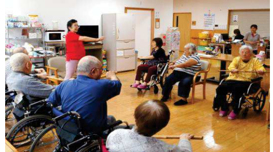
デイルームでの体操風景